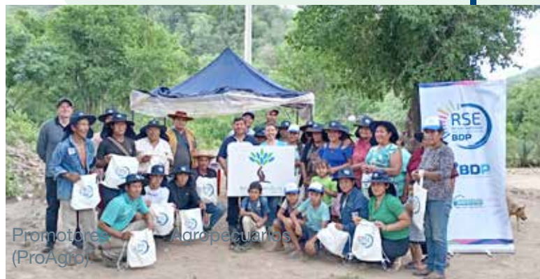
Promotores Agropecuarios (ProAgro)

En 2026 el BDP-SAM tiene proyectado ampliar el alcance del programa, cumpliendo así la meta trazada para los cuatro años de beneficiar a más de 1.400 personas. Esta última fase buscará articular los logros: priorizando la creación de redes de comercialización, el fortalecimiento de alianzas y la continuidad de iniciativas productivas.